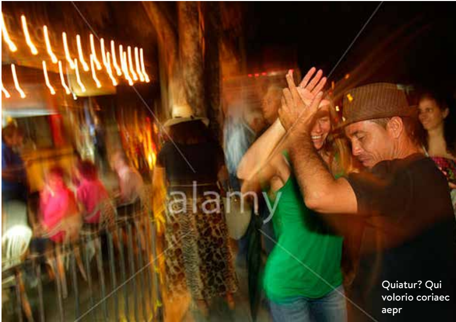
Quiatur? Qui volorio coriaec aepr

alguno de sus cuadros de estilo afro-cubano. En su galería hay muestras de pinturas tradicionales cubanas, santos y guajiros, llenas de simbolismos. 2. CASA PANZA CAFÉ. Un pedacito de España se traslada a esta calle de la Pequeña Habana para conquistar a los visitantes con sus show flamencos, paellas, sangrías y vinos. La música siempre es en vivo y el ambiente cobra mucha vida los viernes y sábados por la noche. 3. ALFARO'S. Una suerte de lounge, cuyo fuerte son las presentaciones en vivo. Se mueve entre la salsa, el jazz, la trova y los boleros; con buenas tapas y vinos. El que quiera pasar un rato ameno debe entrar aquí. 4. EL CRISTO CUBAN RESTAURANT & CATERING. Para probar una buena limonada fría, plátanos y yucas fritas, acompañadas del conocido mojito cubano, hay que hacer una parada aquí. Pequeño, pero amable; también es posible conseguir sándwiches preparados al estilo cubano. 5. LITTLE HAVANA CIGAR FACTORY. Un rincón curioso, que huele a habanos incluso desde la otra esquina. Entrar es caer en años de tradición tabacalera, es respirar a Cuba entera. Además de poder adquirir aquí los habanos que se deseen, hay un lounge pequeño que, a veces, parece un cuadro: hombres vestidos de blanco, con sus sombreros, guayaberas y zapatos que a cada